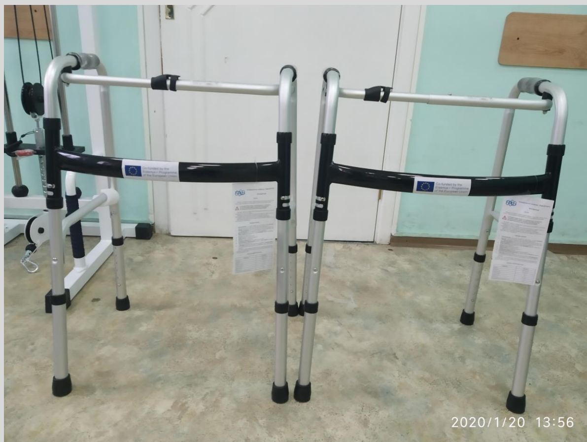
Ходунки для інвалідів 2 в 1 OSD-EY-913/ Walkers for people with disabilities 2 in 1 OSD-EY-913