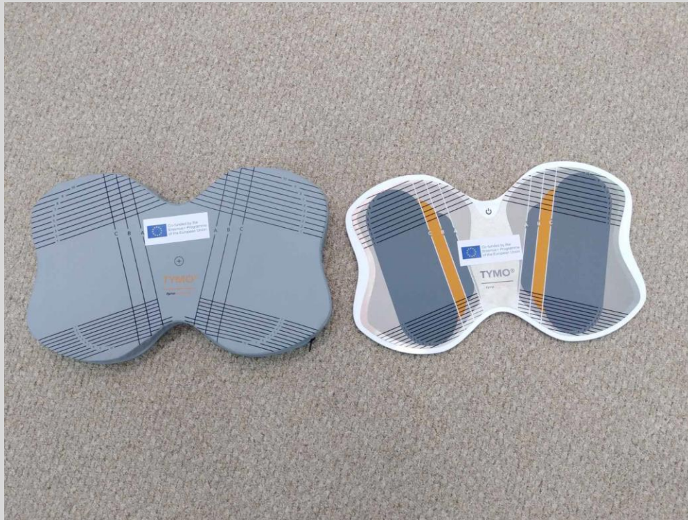
Стабілоплатформа для функціональної оцінки та реабілітації Тімо. Стабілоплатформа у складі: платформа, роликові елементи 1Д та 2Д, протислизька мультидошка, програмне забезпечення ТайрОС/Тумо - Therapy Plate/ Тумо - Therapy Plate