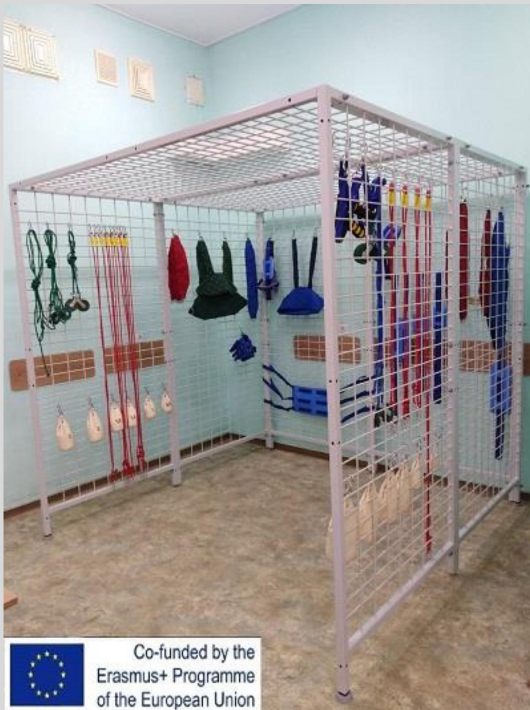
Універсальна кабіна для підвісної терапії WSC-4

(в комплекті набір аксесуарів повний)/ UNIVERSAL CAGE FOR HANGER THERAPY WSC-4