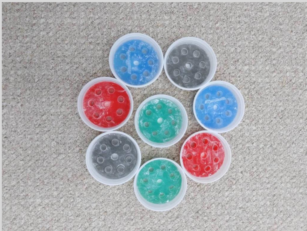
Тренажер для кисті Xtrainer Thera-Band, червоний/початковий рівень/ HANDXTRAINER, red, beginner