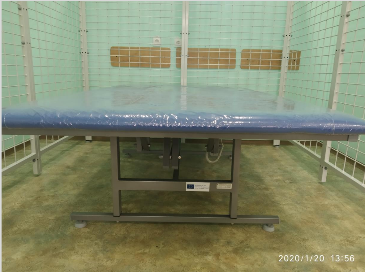
Стіл реабілітаційний SR-EB з електричною зміною висоти/ REHABILITATION TABLESR-EB WITH ELECTRIC ADJUSTMENT OF HEIGHT