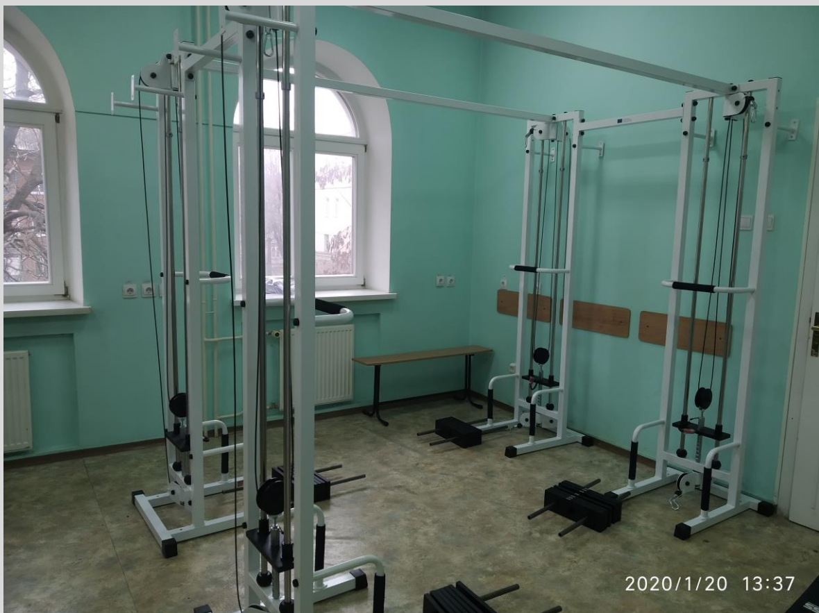
Тренажер багатofункційний, спарений/ MULTIFUNCTIONAL SIMULATOR, PAIRED