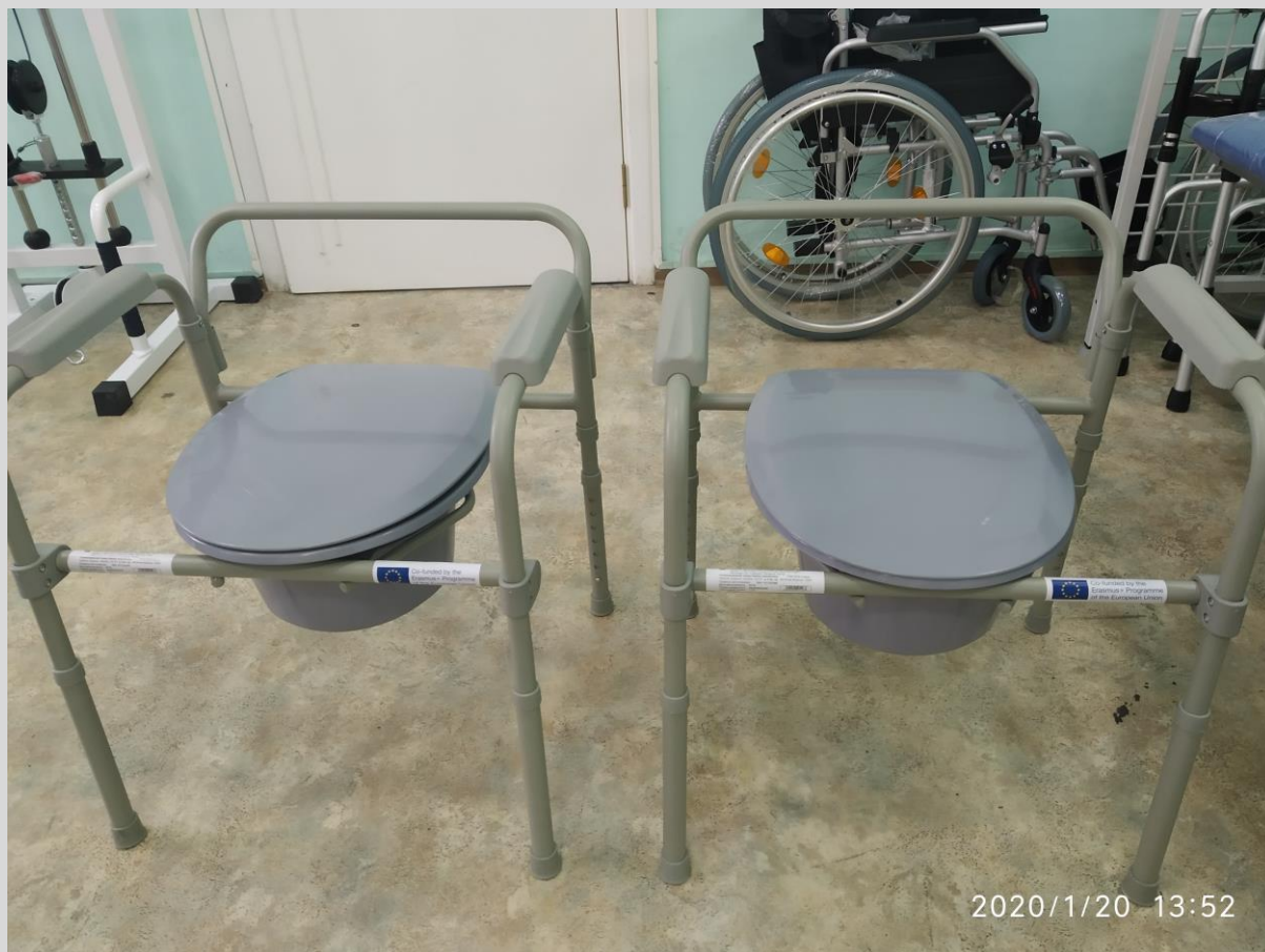
Стілець-туалет OSD-2110C/ CHAIR-TOILET OSD-2110C