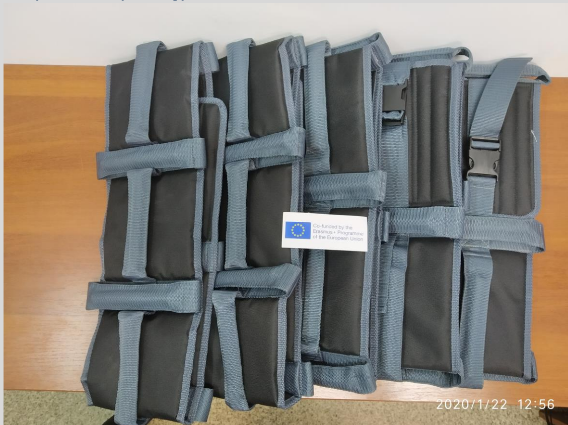
Пояс для підймання людини у інвалідному візку СПА.В.00.1/ BELT FOR LIFTING A PERSON IN A WHEELCHAIR SP.V.00.1