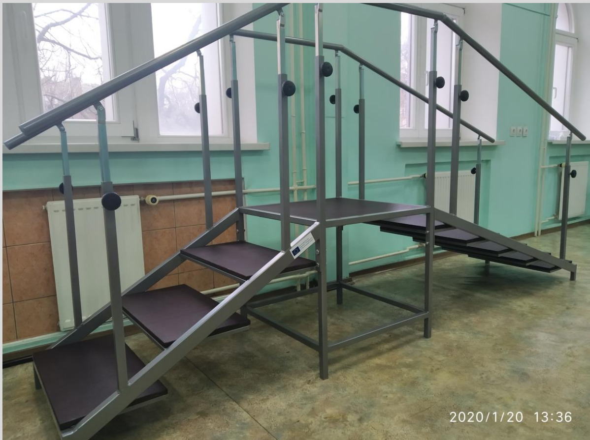
Сходи для навчання ходьби двосторонні SCHR/ STAIRS FOR WALKING PRACTISE SCHR