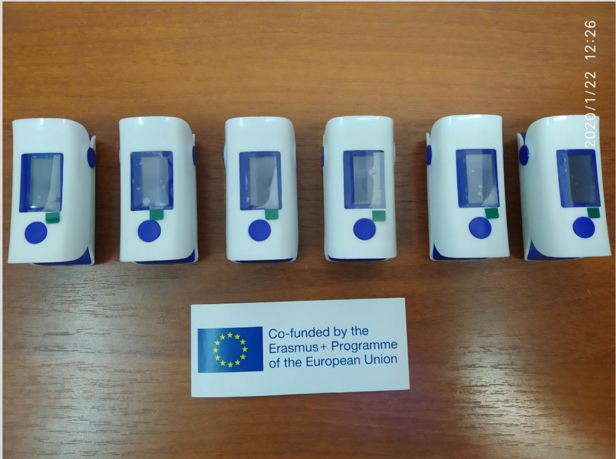
Пульсоксиметр MEDICARE/ PULSE OXIMETER "MEDICARE "