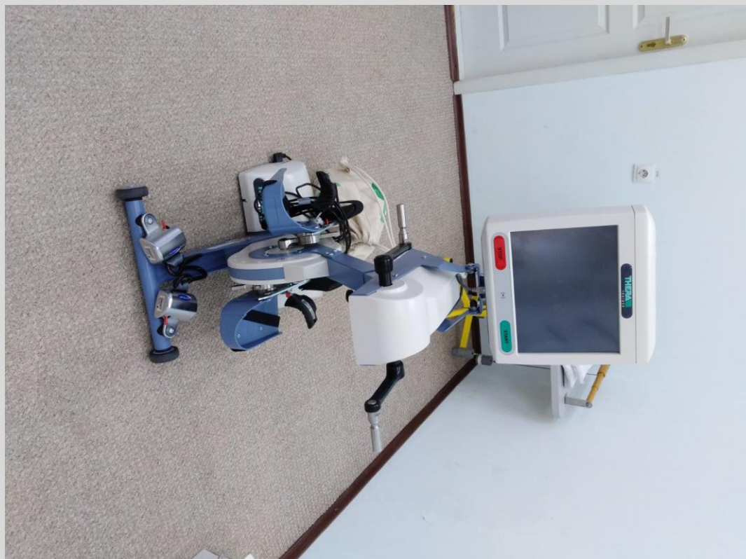
Пристрій для тренування верхньої та нижньої частини тіла Тера-трейнер тіго/ THERA-Trainer TIGO