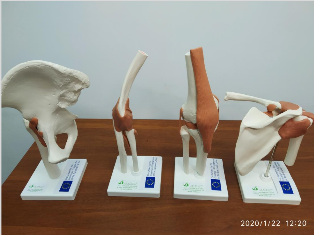
Колінний суглоб, функціональна модель/ KNEE JOINT, functional model Плечовий суглоб, функціональна модель/ SHOULDER JOINT, functional model Ліктьовий суглоб, функціональна модель/ ELBOW JOINT, functional model Кульшовий суглоб, функціональна модель/ HIP JOINT, functional model