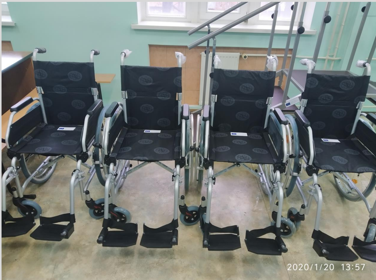
Коляска ерголайт колір сірий 40 OSD-EL-G-40/ ERGOLITE STROLLER, color grey 40 OSD-EL-G-